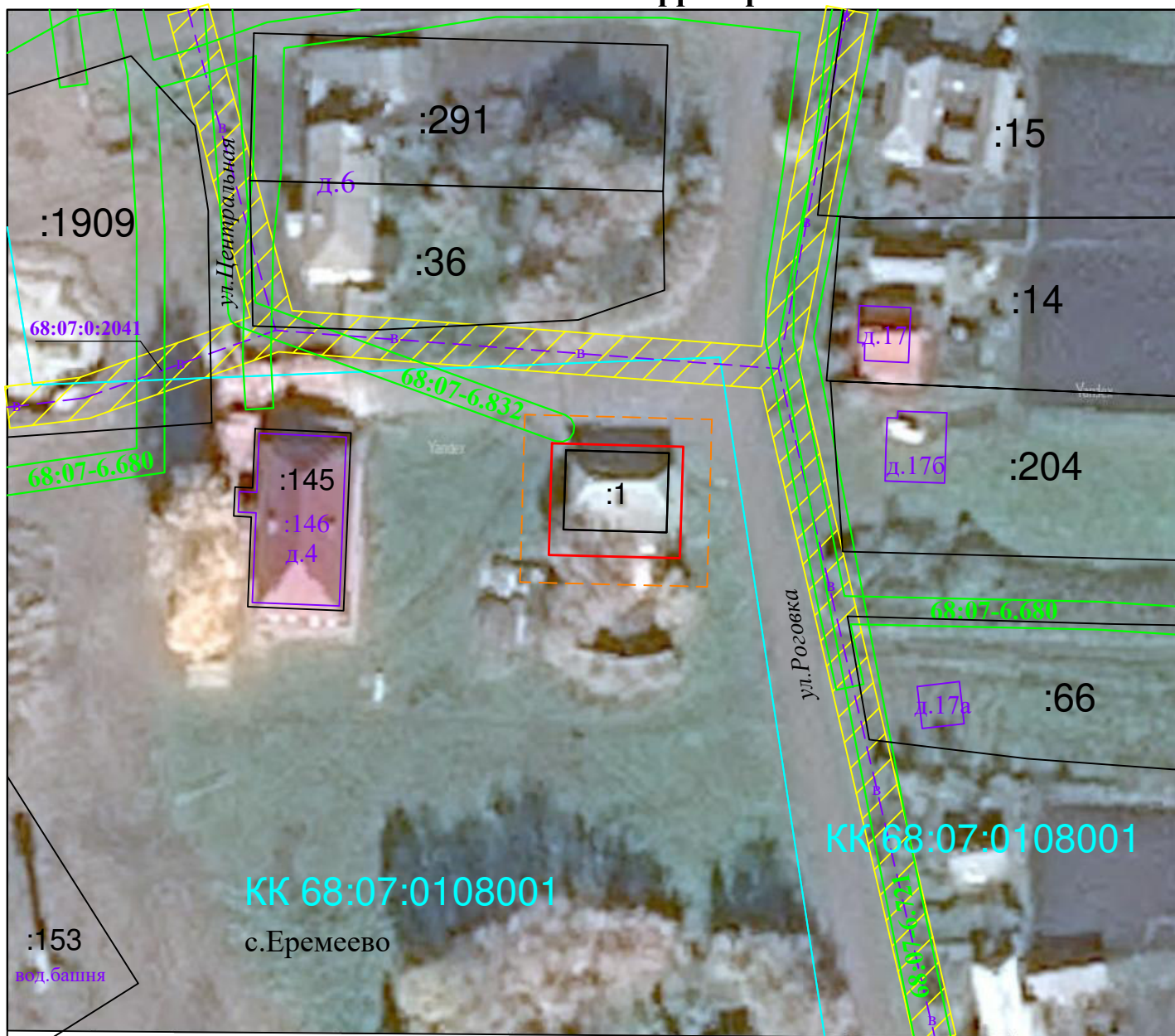
Схема границ зон с особыми условиями использования территории